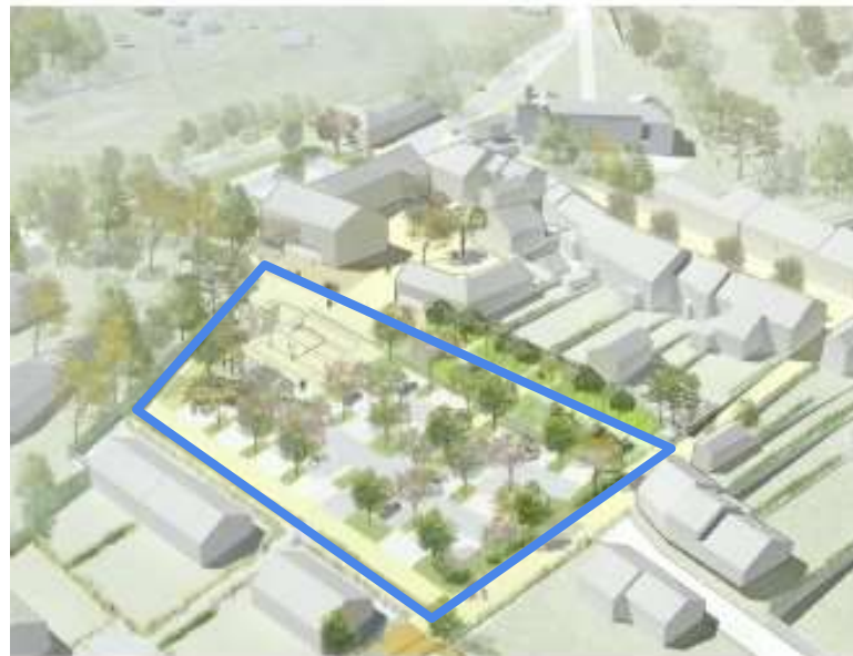
SCOT: Schéma de COhérence Territoriale, PADD: Plan d'Aménagement et de Développement Durable, PLU: Plan Local d'Urbanisme

Préserveons notre village et la qualité de notre environnement